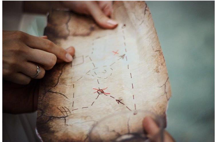
Figura 1. Mapa do tesouro.

Nesta atividade, vais ter a possibilidade de criar esse mapa, e escrever instruções de forma secreta. Como estás na Páscoa, podes fazer esse mapa com a planta da tua casa, e o teu tesouro podem ser ovos de chocolate... Vamos a isso?